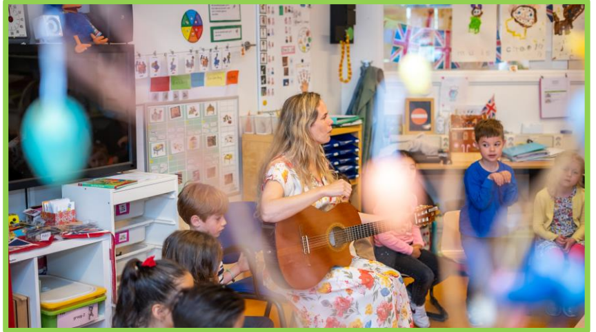
Een kringactiviteit in de kleutergroep.

De leerkracht begroet de leerlingen iedere ochtend bij de deur. In de kring of aan tafel staan de stoelen met daarop de naam van ieder kind. De leerlingen wassen hun handen en gaan zitten op hun stoel. Ze gaan zitten, lezen eventueel een boekje of gaan spelen met wat er klaargezet is. Er wordt gestart met een openingsliedje, soms in het Nederlands, soms in het Engels. Een vast begin van de dag is het doornemen van het dagritme: wat gaan we vandaag doen? Het dagritme wordt zichtbaar gemaakt door dagritmekaarten. De eerste activiteit van de dag is vaak een kringactiviteit, maar er kan ook gestart worden met een opdracht of de speelwerkperiode. Een kringactiviteit kan bijvoorbeeld een taal- of rekenles zijn. De les start met het benoemen van het doel. Doelen hebben betrekking op het thema, de reken- of taalactiviteit, maar er zijn ook sociaal-emotionele en creatieve doelen. Er wordt gewerkt in grote én kleine kringen, waarin wordt gedifferentieerd naar niveau. Er wordt een duidelijke instructie gegeven door de leerkracht en er wordt samen inge oefend.