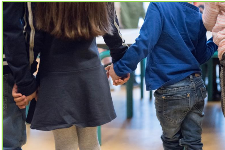
Samen werken en spelen met je maatje(s).