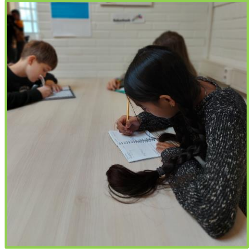
Leerlingen van groep 8 oefenen met het plannen in hun agenda.

In groep 8 wordt de zelfstandige houding van de leerlingen nog groter en bereiden wij ons langzaam voor op de overstap naar het voortgezet onderwijs. Leerlingen plannen zelf hun werk in en werken gedurende de week aan hun geplande werk. Leerlingen die dit lastig vinden worden ondersteund door de leerkracht. De nieuwe weektaak wordt op het bord getoond en uitgelegd. Leerkracht geeft tips voor het plannen. Ook leren de leerlingen van de groepen 8 hun agenda gebruiken om zo veel mogelijk zelfstandigheid te bevorderen. In groep 7 is hier al een start mee gemaakt (door het plannen van huiswerk in de agenda). Op de weektaak staat voldoende werk voor de leerlingen in groepsverband. Daarnaast is er ruimte voor eigen inbreng van de leerling, en is er aandacht voor keuze en variatie van het werk in niveau, tempo, extra opdrachten en plusopdrachten. De leerlingen maken hier zelf keuzes in, uiteraard onder toezicht van de leerkracht. In groep 8 kijken de leerlingen hun eigen werk na. De leerlingen maken zelf keuzes in wat zij willen (en moeten) doen in zelfstandig werktijd. Het nagekeken werk leveren zij op de juiste plek in. Indien de leerling na het nakijken ontdekt dat er veel foutjes in het werk zaten, of dat de leerling graag nog extra uitleg zou willen, wordt het schrift in de hulpbak gelegd. De leerkracht bekijkt welke moeilijkheden er nog in het werk zitten en bespreekt dit na met de leerlingen.