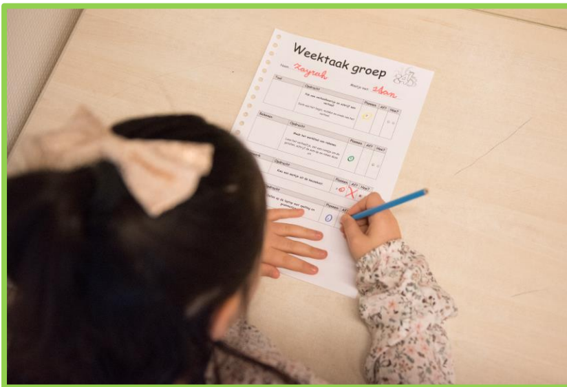
De weektaak inplannen en afkruisen in groep 4.

Op maandagochtend wordt de weektaak besproken en uitgelegd. Er wordt verteld waarmee rekening gehouden moet worden qua tijd en weekindeling en de opdrachten van de weektaak worden verduidelijkt met een korte instructie. De leerlingen denken na over welke taak ze wanneer gaan maken, met wie en hoeveel tijd zij hiervoor nodig denken te hebben. De leerlingen zijn zelf verantwoordelijk voor het plannen, bijhouden en afkruisen van het werk. De leerlingen maken voor zichzelf een overzicht van welk werk zij wanneer gaan doen. De leerkracht heeft hierin zeker begin groep 4 een begeleidende taak. De leerkracht bekijkt wel hoe de leerling functioneert op gebied van plannen. Heeft de leerling bijvoorbeeld al een aantal weken moeite om de weektaak af te krijgen? Dan kan de leerkracht ondersteunen en soms sturen bij het plannen. Gebruikte vragen zijn dan: Wat is bijvoorbeeld verstandig om eerst te maken? Wat kun je beter bewaren voor later in de week? Zo krijgen leerlingen ook meer besef van taakoverzicht. De leerkracht van groep 4 houdt een aftekenlijst in de klassenmap bij met welk werk door de leerlingen is gemaakt en/of nagekeken. Tussendoor (meestal op woensdag) bekijkt de leerkracht het tot dan toe gemaakte werk en gaat met de leerlingen in gesprek over de taken die zij nog moeten doen. Dit geldt vooral voor de leerlingen die meer moeite hebben met het plannen van hun werk. In dit gesprek wordt mondelinge feedback gegeven.