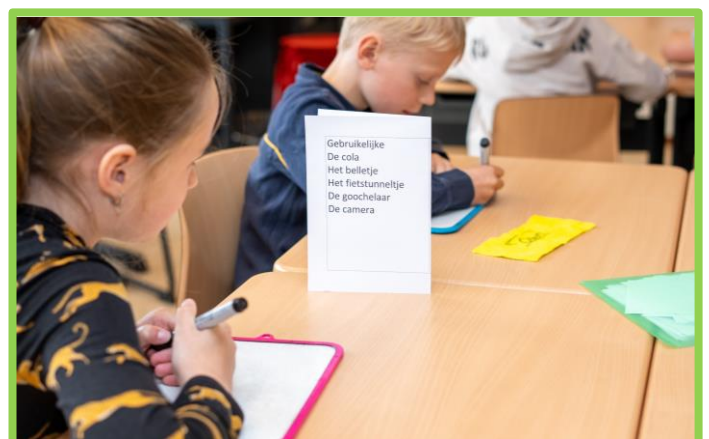
Twee leerlingen van groep 5 nemen bij elkaar een dagelijks dictee af.

Tijdens het zelfstandig werken hebben de leerlingen een blokje op hun tafel. Willen ze niet gestoord worden, ligt de rode kant boven. Hebben ze een vraag, ligt het vraagteken boven. De kleur van het blokje bepaalt niet of er wel of niet gesproken mag worden. In principe werk je óf zelfstandig en dus stil óf samen en gebruik je (indien nodig) je fluisterstem. Het vraagteken maakt voor de leerkracht zichtbaar wie er een vraag heeft aan de leerkracht. Door vaste rondes te lopen speelt de leerkracht in op deze vragen. De leerlingen zijn zelf verantwoordelijk voor hoe zij hun tijd indelen of krijgen een gerichte