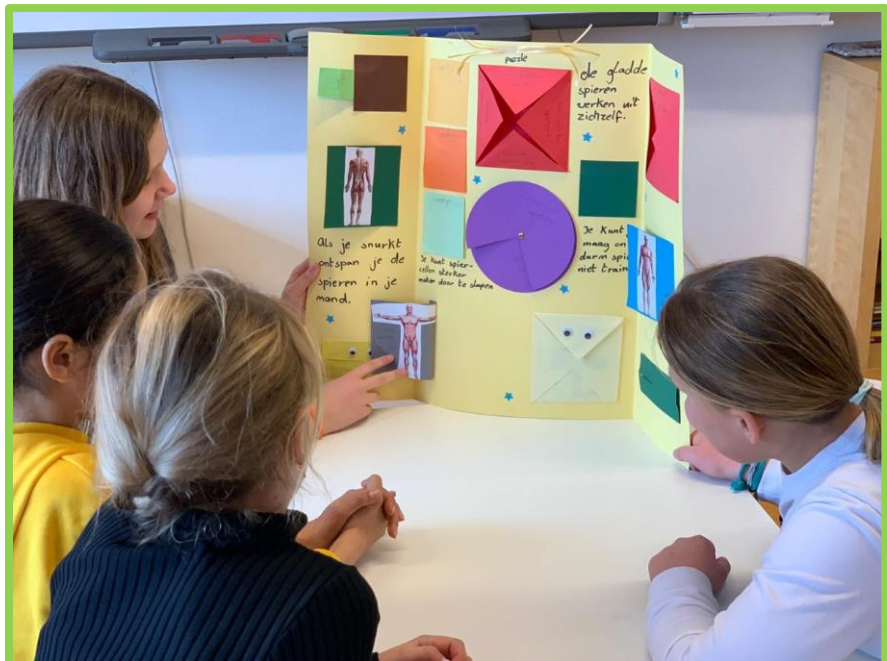
Leerlingen presenteren de uitwerking van hun onderzoeksvraag aan elkaar (hier d.m.v. een 'lapbook').

Instructies zijn zo veel mogelijk interactief, door het inzetten van werkvormen van 'Teach Like a Champion'. Leerlingen steken bijvoorbeeld minimaal hun vinger op, maar werken met wisbordjes om een antwoord te noteren. De leerkracht stelt vragen aan de hand van beurtstokjes om de betrokkenheid te vergroten. Bij de instructies wordt gewerkt met de stappen van het directe instructiemodel. Het doel van de les wordt aan het begin verteld, maar ook het 'waarom' wordt verteld. Na de algemene instructie, gaat de instructie