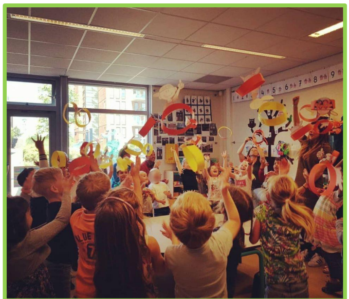
Ouders en leerlingen vieren samen feest bij de uitreiking van het

Onze school doet ieder jaar mee aan de Nationale Daltondag. De landelijke dag waarin Daltonscholen hun onderwijs presenteren is in maart en heeft ieder jaar een andere vorm. Voorgaande jaren hebben we groepsdoorbroken gewerkt. De Daltondag viel in de projectweek. Hierdoor hebben we de Daltondag en het thema van de projectweek gekoppeld aan elkaar. In elke klas stond er een kernwaarde centraal en stonden we met de leerlingen stil bij 'wat is Dalton'? Wij vinden het prachtig om te zien dat voor onze leerlingen het daltononderwijs 'gewoon' is. Het thema is in één van de voorgaande jaren dan ook 'Gewoon Dalton' genoemd.