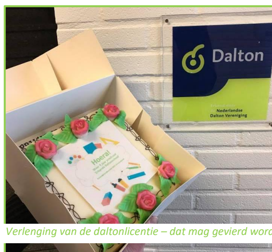
Verlenging van de daltonlicentie – dat mag gevierd worden.

Ons doel is om leerlingen een goede basis mee te geven voor hun toekomst, om hen te helpen zelfstandigheid en verantwoordelijkheid te ontwikkelen en om keuzes te leren maken. Het is ook ons doel om de leerlingen te laten reflecteren op hun eigen handelen. Ons streven is om het onderwijs zo goed