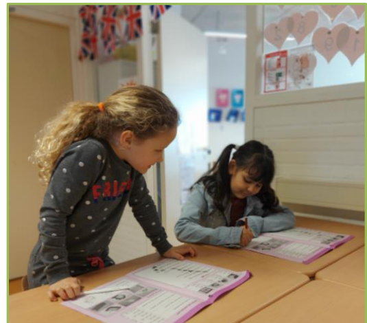
Leerlingen werken samen – coöperatieve werkvorm.

Wij streven naar een doorgaande lijn in de ontwikkeling van het samenwerken. Deze ontwikkeling verloopt van samen spelen naar samen werken en zodoende van samenwerken naar samen leren. Samenwerken vinden wij een belangrijke voorwaarde om in de toekomst deel te kunnen nemen aan de maatschappij. Essentiële vaardigheden hierbij vinden wij dat de leerlingen leren om naar elkaar te luisteren, te overleggen, eigen inbreng durven te geven en standpunten in kunnen nemen. Wij bieden een veilige en uitdagende omgeving waarin leerlingen samen kunnen spelen, werken en leren. Dit is o.a. terug te zien in de inzet van coöperatieve werkvormen, de Kanjertraining, het schoolproject, het groepsdoorbrekend werken en gezamenlijke werkplekken in de klas en op de gang.