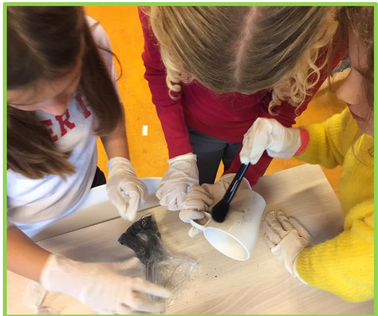
Samen onderzoeken in de plusklas – thema forensisch onderzoek.

Ook voor onze meer- en hoogbegaafde leerlingen bieden wij extra uitdaging. Op onze school werken wij met plusklassen en een ontdekclub. Wij hebben een plusklas voor leerlingen van de groepen 2 t/m 4 (onderbouw) en een plusklas voor de leerlingen van de groepen 5 t/m 8 (bovenbouw). De plusklassen bestaan uit leerlingen die naast de reguliere aanpassingen voor (meer- en hoog) begaafde leerlingen nog niet voldoende uitdaging vinden binnen de groep. In de klas plusklas worden de kwaliteiten van leerlingen zo veel mogelijk aangesproken en ontwikkeld. Voorop staat dat iedere leerling zijn kennis en vaardigheden ten volle ontwikkelt naar eigen vermogen. De plusklas geeft (meer- en hoog) begaafde leerlingen tevens de mogelijkheid om gelijkgestemden te ontmoeten en met hen samen te werken. Dit biedt een duidelijke meerwaarde in hun ontwikkeling. Leerlingen komen in de plusklas een dagdeel per week bij elkaar (onder begeleiding) van onze talentbegeleiders buiten de groep. Zij verdiepen