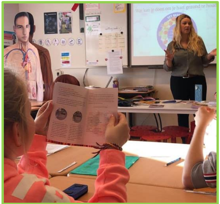
Een ouder geeft een gastles tijdens de projectweek.

Op OBS Groenehoek zijn wij trots op de hoge mate van betrokkenheid die wij zien bij ouders, leerkrachten én leerlingen. Zo organiseren wij meerdere malen per jaar kijkochtenden, waar ouders een les bij kunnen wonen in de groep van hun zoon of dochter. De opkomst tijdens deze ochtenden is altijd groot. Ook de betrokkenheid van de ouderraad op onze school is groot. De ouderraad organiseert veel van de activiteiten voor de leerlingen en worden hierin bijgestaan door één of twee leerkrachten. De ouderraad doet bij veel van deze activiteiten ook weer een beraad op andere (hulp)ouders. Ouders staan altijd klaar om te helpen en er is goed overleg tussen de leerkracht en ouder om te zorgen voor een optimale ontwikkeling van het kind. We waarderen deze inspanningen van beide kanten. Samenwerken is hierin de sleutel tot succes. Ook leerkrachten zijn onderling betrokken bij elkaar, het samenwerken als team, het bij elkaar kijken, elkaar om hulp vragen en bijstaan en van elkaar leren.