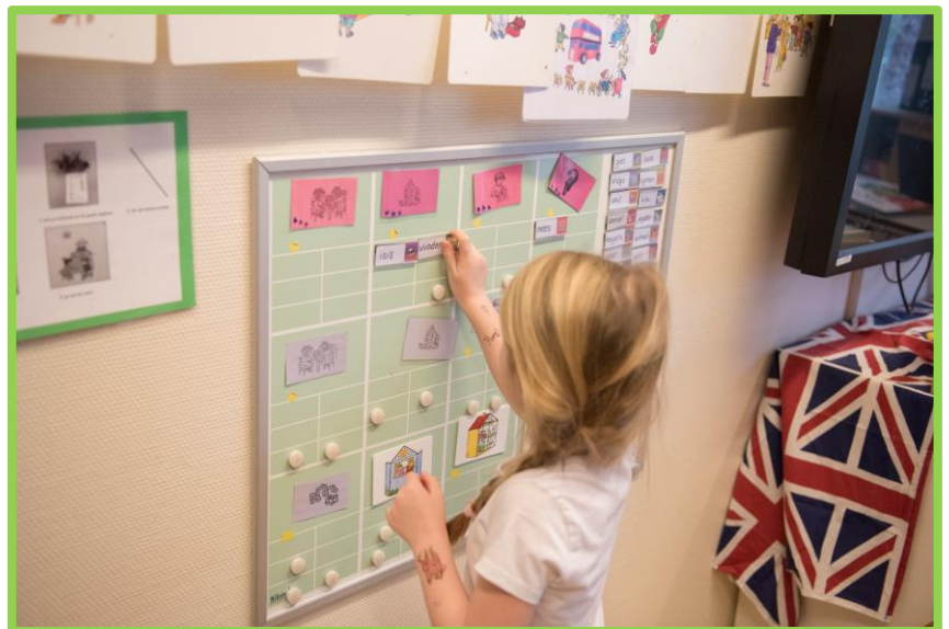
Een kleuter hangt haar naamkaartje op het bord bij het pictogram van het taakje dat zij gaat doen.

Door het weektaakblad te gebruiken leren de leerlingen zelfverantwoordelijk te zijn. De weektaak is gekoppeld aan het digikeuzebord. Iedere leerling heeft een eigen 'naamkaartje' om op het digikeuzebord verplaatsen. De plaatjes voor de verschillende onderwerpen van het weektaakblad zijn gelijk aan de plaatjes op het digikeuzebord. Diezelfde plaatjes zijn ook zichtbaar in de klas. Door deze visuele ondersteuning wordt het voor de leerling gemakkelijk om werk te kiezen en pakken, waardoor de zelfstandigheid gestimuleerd wordt. Leerlingen bekijken hun weektaakblad en kiezen vervolgens op het keuzebord waar ze hun kaartje op hangen. Naast de taken van de weektaak is er ook